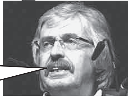
アクセル・ケーラー・シューラ氏エテコンの会長